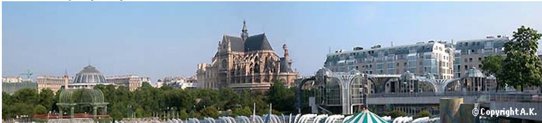
Quartier des Halles à Paris (France)