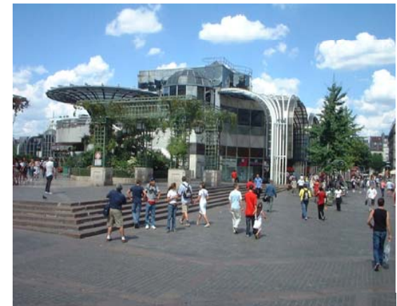
Quartier des Halles à Paris (France)