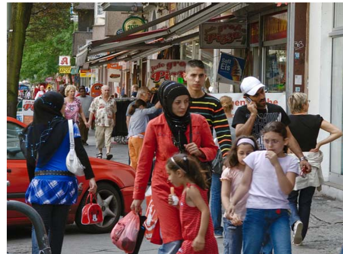
Quartier Kreuzbuerg à Berlin (Allemagne)