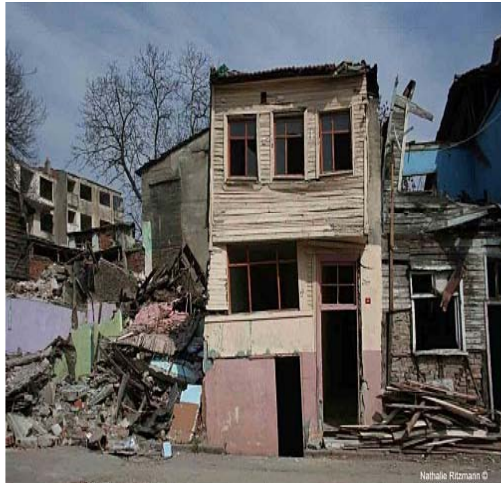
Quartier Sulukule à Istanbul (Turquie)