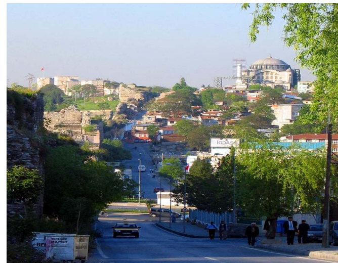
Quartier Sulukule à Istanbul (Turquie)